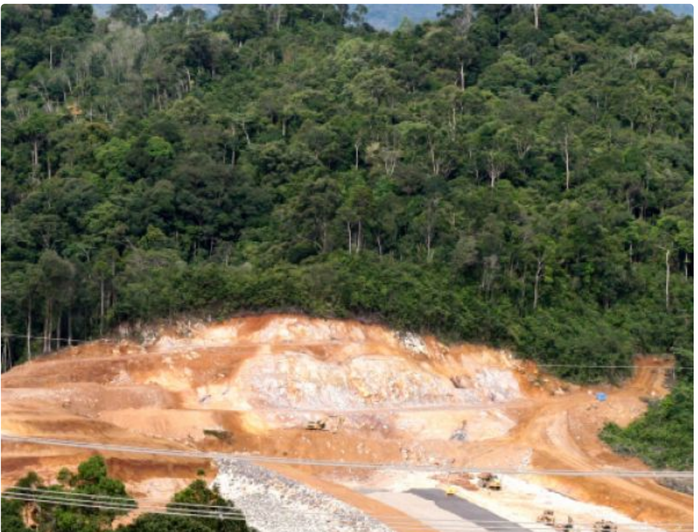
Tambang emas yang beroperasi di hutan Sumatera Utara.

SURABAYA – Ekonom lingkungan Stefan Giljum et al. mengeluarkan penelitian yang berjudul “A Pantropical Assessment of Deforestation Caused by Industrial Mining.” Disitu disimpulkan bahwa Indonesia menempati posisi pertama dalam